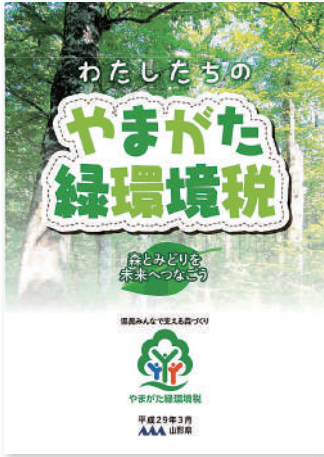
やまがた緑環境税パンフレット

支援制度には組織づくりの支援、人材育成や人材確保に関する支援、資金面での支援、研究事業や新規事業への支援などがあります。山形県では県民や法人から「みどり環境税」を納めていただき、山形県の財産である森林整備や森づくり活動などに活用しています。