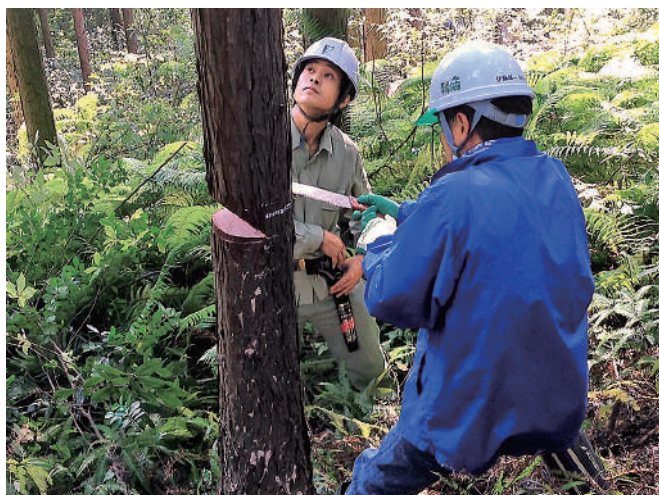
間伐作業

るイヌワシと、その生息環境を保全するために、サステナビリティ活動の一環として「クラッチの仲間イヌワシを守ろうプロジェクト」という活動を実施しました。その取り組みの一つである「やまがた絆の森(楽天の森)プロジェクト」では、山形県と山形大学との3者による協働で、山形県鳥海山の人工スギ林の間伐や作業道の整備を行いました。