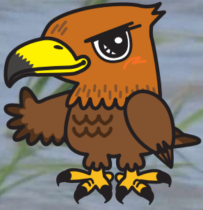
鳥海イヌワシみらい館 マスコットキャラクター 「ワッシーくん」