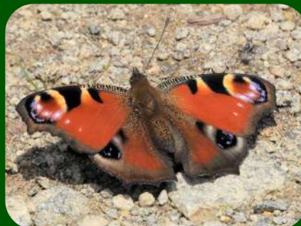
2021/6/25 「クジャクチョウ」秋田県 クジャクの羽のような目玉模様が美しいチョウ。北方系のチョウで生息できる地域もだんだんと北上しているようです。なんとかしないと！