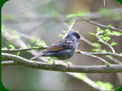
2021/4/24 「クロジ」酒田市 アオジ、キジ、クロジ・・・赤字がいたら見たくない鳥かもしれませんね。