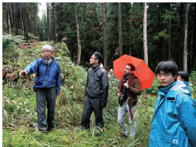
楽天の森施業地(2017年 酒田市)