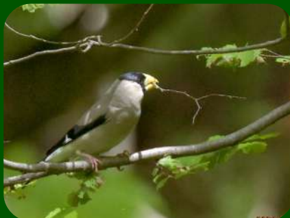
2021/5/14 「イカル」新潟県 枝を口にくわえて繁殖の準備をしているそうです。木の実が大好きな鳥で、太いくちばしは木の実を割るのに適した形状です。