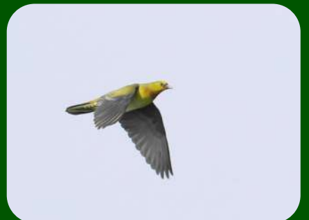
2021/6/26 「アオバト」神奈川県 緑色の美しい体ですが、良く見るとのどやクチバシの周りが赤く色づいています。ヒナへ給餌する際にヤマザクラの果汁がこぼれて着色されたのではないかとのことです。