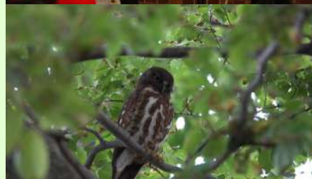
酒田の市街地でも観察できた「アオバズク」