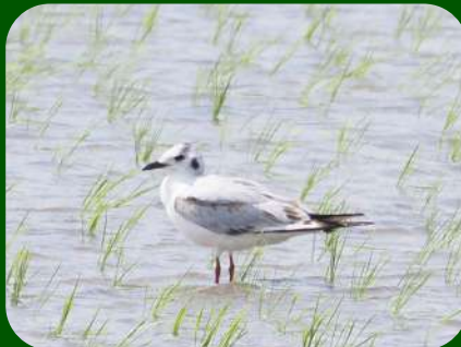
2021/5/29 「ズグロカモメ」酒田市 本来、夏になると頭部が黒くなるはずのズグロカモメですが、若いころは黒くならないので、野鳥の会築川堅治氏曰く、これが「シロガンズグロカモメ」なんだそうです。