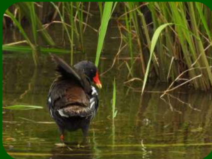
2021/6/20 「バン」鶴岡市 鶴岡市街を流れる河川は意外と気にしてみている人が少ないかもしれないですが、初めて見る人には「なんだ！あの赤いくちばしの鳥は！」となるかもしれないですね。