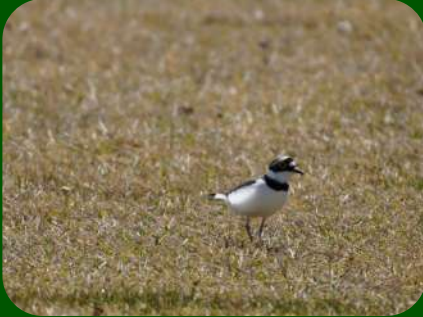
2021/4/12 「コチドリ」酒田市 かわいらしいチドリの仲間。黄色いアイリングが特徴で愛くるしくちょろちょろと走り回ります。まさしく千鳥足。

果樹王国山形県ですが、生産量日本一を誇る初夏の風物詩サクランボが、春の低温の影響もあって例年になく不作となってしまったそうです。向こう3か月予想でも涼しい傾向という予報もあり、夏の気候が気になるところです。また庄内では春から多くの迷鳥、珍鳥が報告されています。引き続き各地の自然情報をmoukin@raptor-c.comまでお寄せください。