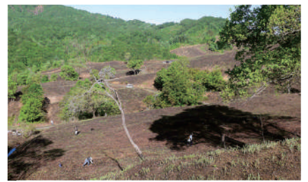
火入れ後の観光わらび園 | 写真提供: 小国町観光わらび園組合

わらび生産量日本一の山形県小国町では、9つの観光わらび園が5月下旬～6月下旬までの約1か月間開園しており、地域おこし協力隊や大学などとも連携することによって、火入れや刈り払いなど、わらび園の環境維持に携わ