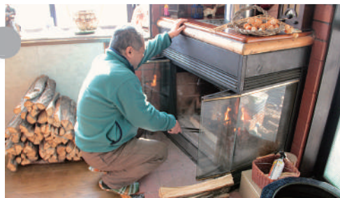
家庭での薪利用