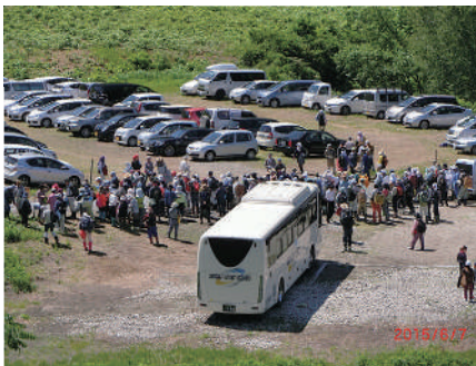
来訪者で賑わう観光わらび園

するためには必要不可欠です。整備活動は景観の維持・改善はもちろんのこと、生物多様性にも貢献しています。