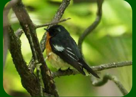
2021/5/3 「ムギマキ」酒田市 庄内では鳥海山に「種まき爺さん」が姿を現すと農作業の準備が始まりますが、全国的には麦を撒くころにやってくるムギマキを見れば、麦を撒く頃合いです。見られない年もあるので指標にするのはちょっと・・・