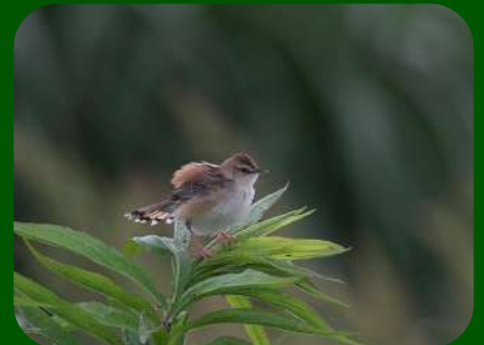
2021/6/30 「セッカ」酒田市 山形県では絶滅危惧ⅠA類となっているほど見ることが難しいセッカ。どうやら4年ぶりの観察記録だとか。