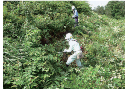
交付金によるススキ草原維持のための手刈り作業

業に採択をされました。ススキ草原維持のための手刈り作業や牛放牧事業を実施し、生物調査などモニタリングも実施することで、効率的な維持管理作業に役立っています。