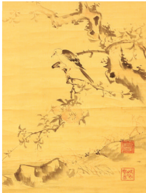
徳川 慶喜 「花鳥画(ギンムドリ)」 公益財団法人致道博物館 所蔵

例えば日本画には、円山四条派、琳派、狩野派などいくつかの流派が存在しており、描かれた時代の流行など作品の背景を知ることによって、絵画をストーリーとして楽しむこともできます。