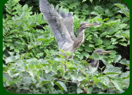
2020/7/24 「ササゴイ」 鶴岡市 市の中心部にある鶴岡公園では、コロナ禍の中人知れずササゴイの幼鳥がすくすくと育っていました。