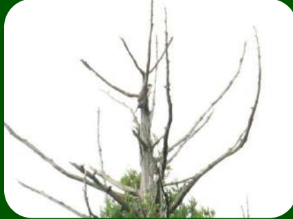
2020/7/3 「ハイタカ」鶴岡市 ここはオオタカの生息する池が見下ろせる立ち枯れの木。なわばりに入っていることがばれないうちにそーっと立ち去ったようです。オオタカチャレンジというやつかもしれません。