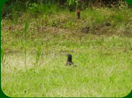
2020/7/3 「ハチクマ」 遊佐町 絶賛子育て中のハチクマ！地面に降り立っているという事は・・・そこにきっとご馳走があったに違いない？

豪雨被害、台風の接近などまさに我慢が続いた今年の夏～秋シーズン。山形県ではブナの実の凶作も影響し、市街地までも連日ツキノワグマが出没している状況です。ラニーニャ現象の発生もあり、冬も気を抜くことができません。各地の自然情報を moukin@raptor-c.comまでお寄せください。