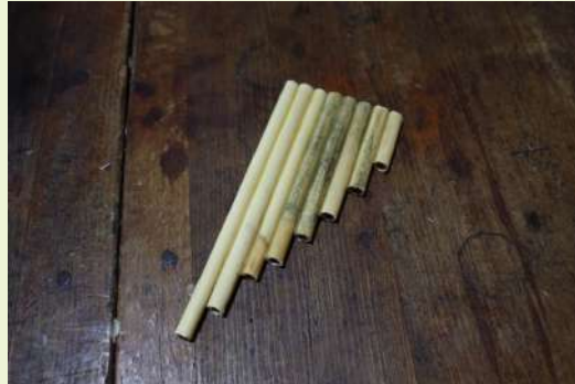
完成した葦笛「パンパイプ」