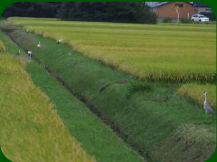
2020/9/8 「コウノトリ(3羽)」 酒田市 今年の春に兵庫県と福井県で生まれたヤングな子たちのようです。エサの少なそうな用水路を大きなくちばしでつつきながら歩いていたそうです。手前のアオサギが「見ねえ顔だな・・・」