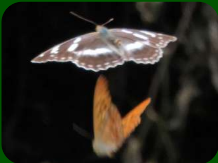
2020/8/4 「メスグロヒョウモン」 鶴岡市 名前の通りメスのみが黒っぽい色をしたヒョウモンチョウ。奥をとぶ「別種か？」と見まごうばかりのオレンジが鮮やかなチョウが、オスのメスグロヒョウモン。オスなのにメスグロヒョウモンと呼ぶことに若干抵抗あります。