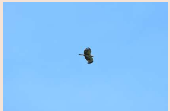
目の前を通過した「ハチクマ」