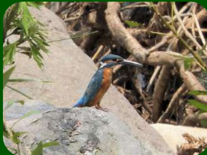
2020/8/4 「カワセミ」 鶴岡市 周囲がからからに乾燥しているからでしょうか、翡翠色が岩に映えますね。暑いから川でひと風呂浴びますか！？