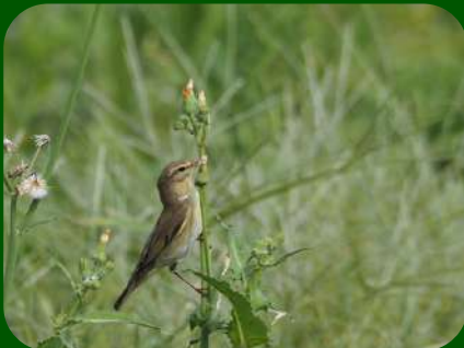
2020/9/22 「キタヤナギムシクイ」 酒田市 酒田市の離島、飛島の9～10月は秋の渡りのシーズン。多くの小鳥や猛禽類たちが中継地として訪れます。