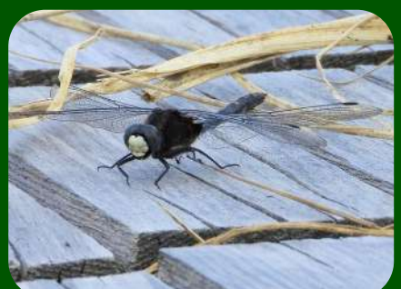
2020/7/30 「カオジロトンボ」 秋田県 シオカラトンボ、ノシメトンボ、マイコアカネ奥深きトンボの和名の中で、ドストレートに「顔白」。「公家トンボ」とかひねると認知度が上がったかも？（分布領域の問題です）