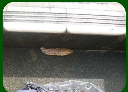
2020/8/13 「ヤマナメクジ」 酒田市 思わず何かの糞かなと大変失礼な感想を持ってしまったこと、深くお詫び申し上げます。10cmは超えていると思われるこのナメクジは、翌日にはいなくなっていました。食べられた？